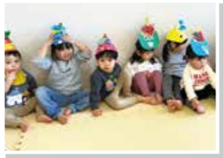
素敵なお面でしょ