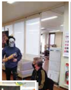
緊張感ただよっ戦い