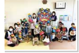
大きな鬼と一緒に写真を撮ったよ