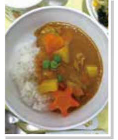
カレーライスできあがり