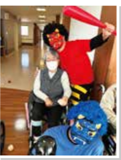
本日は優しい鬼さんたちです

〜赤鬼と青鬼と一緒に登場!〜 例年、ライフステージ三春では2月3日の節分に5階のラウンジにて鬼退治＆豆まきを行っています。 毎年鬼は赤鬼青鬼交互に登場していましたが、今年は何とダブルで登場です!! 「ワ〜イ鬼達が暴れまわります。でも大丈夫！鬼は外〜福は内〜と掛け声をかけながら大きな豆玉でやっつけます。みんなで力を合わせて鬼退治できました！無事に退治できた記念に赤鬼と青鬼と記念撮影をパチリ。 鬼退治の後は、赤チーム、青チームに分かれて豆入れゲームをしてとても楽しいひとときを過ごすことができました。