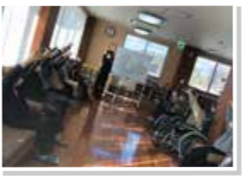
準備運動をしっかりと!