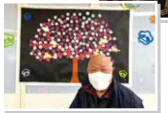
満開の梅が咲いたよ♪