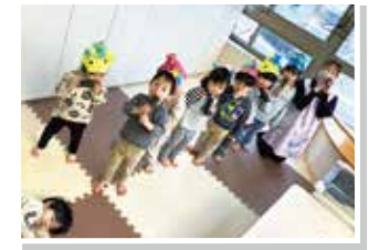
東北東を向いて食べるんだよ

〜鬼は外〜福は内〜 エルキッズ保育園八山田では2月2日に豆まき会を行いました。各クラスごとに製作した鬼のお面を子ども達は気に入って被り、豆に見立てたボールで「鬼は外〜福は内〜」と元気よく鬼を追い払っていました。また、ひまわり組は恵方巻きを画用紙で作り、「東北東（恵方）を向いて食べる真似をしました。恵方巻きは災いを払い、ご利益を授かると言われていています。」 今年もたくさん遊んで元気づけたいに過ごせませうよ。