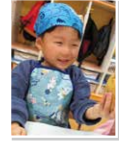
大きなじゃがいもだ！