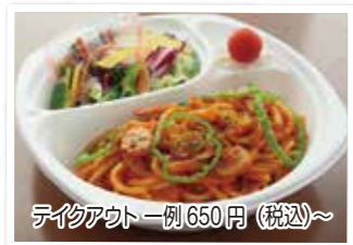
テイクアウト一例650円(税込)~