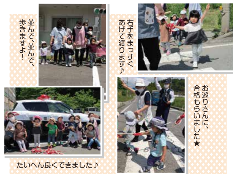
並んで、並んで、 歩きますよ！

そつくりの信号機や横断歩道を見て練習をして から実際の横断歩道を横断しました。園児達は、 緊張した面持ちで真剣に取り組んでいました。 職員も改めて交通ルールの大切さを実感し、み んなが安全で安心に過ごせるように、きちんと ルールを守ることを学びました。