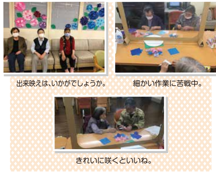
出来映えは、いかがでしょうか。

細かい作業がありました。手を器用に使 い、色とりどりのアジサイが出来あがりまし た。「細かい作業は、大好き」と笑顔も見られ ました。 今後、季節を感じられるイベントで外出気 分を少しでも味わって頂けるよう、感染対策を しっかり行いながら実施して行きたいと思いま す。