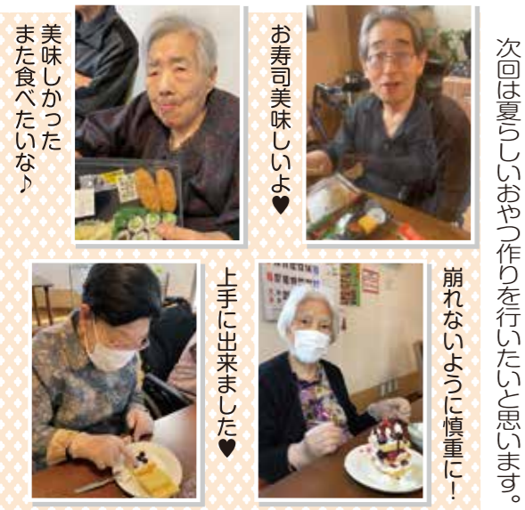
お寿司美味しいよ♡

た食べたい。」との声が聞かれました。今回は、お 寿司以外のテイクアウトも検討していきたいと 思います。 また5月28日には、ケーキ作りを行いました 。今回は、3段のケーキ作りに挑戦し、楽しま れながら生クリームや果物のトッピングをされて いました。 完成した際には「こんなにたくさん食べられな い。」と話されていましたが、「おいしい」との声 も聞かれ、ほとんどの方が全部召し上がってい らっしゃいました。 今回は夏らしいおやつ作りを行いたいと思います。