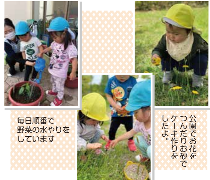
毎日順番で 野菜の水やりを しています

保育園八山田の子ども達は、毎日元気いっぱい です。 2歳児クラスの子ども達は食育活動の一環で ピーマン・ナス・トマト・ゴーヤ・朝顔・風船カズラを 育てています。毎日「おおきくな〜れ〜」と声を かけて水やりをしています。戸外活動では公園で 自然散策やアスレチック遊びで、体を動かしてい ます。感染予防対策及び熱中症対策を徹底し楽 しく過ごしたいと思います。