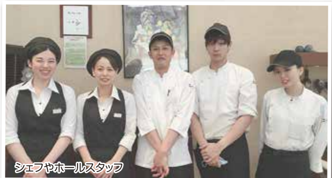
シェフやホールスタッフ