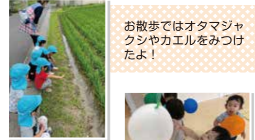
お散歩ではオタマジャクシやカエルをみつけたよ！

アジサイの花がきれいに色づき始め梅雨の気配を感じる時期となりました。エルキッズ保育園八山田の子ども達は、季節の移り変わりを感しながらも元気に過ごしています。 お散歩で田んぼに出かけてはオタマジャクシやカエルを見つけて大きくなる様子を観察しています。 室内活動は、感染症予防対策をしっかりとらえて静と動の活動をバランス良く取り入れ、保育士やお友達と仲良く過ごし関わりも深まってきたように感じます。雨が降ると「あした天気になれ〜！」とおまじないや天気の楽しいお話を聞いたり、カエルの歌を唄いながらびよびよんと跳ねる姿がとっても微笑ましくですね。