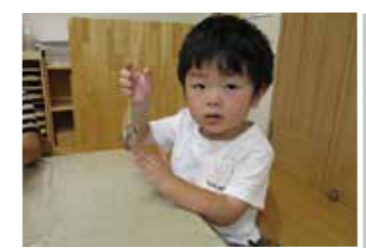
見てみて、上手にできたよ！