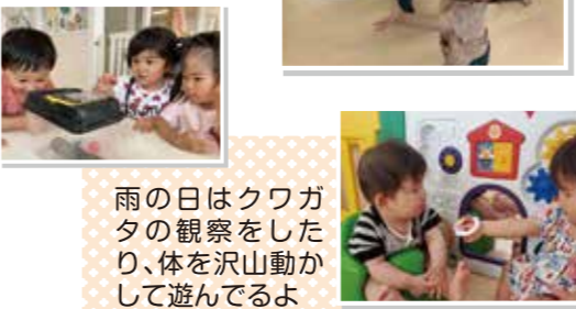
雨の日はクワガタの観察をしたり、体を沢山動かして遊んでるよ