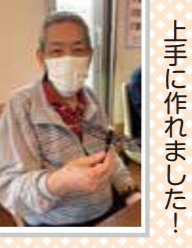
オニヤンマ君 上手に作れました！