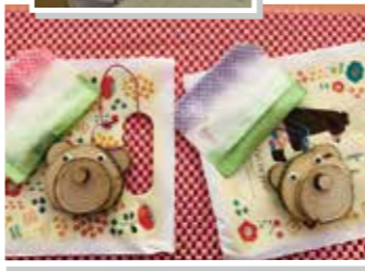
上手に完成しました