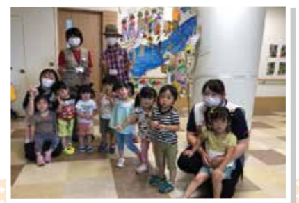
森の案内人さんと一緒にハイポーズ♪

エルキッズ保育園三春では、福島県認定「森の案内人」の方々をお招きし、「コロナ感染症予防対策を行いながら、紙芝居を読んでいたいたり、一緒に木工クラフト製作の体験もしました。 また、七夕にちなみ木材でできた「工」短冊」をいただき、早速、願い事を記し玄関ホールへ飾り付けをしました！ 子ども達は、貴重な体験をする事でき、とても満足げな様子でした♪