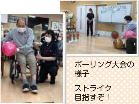
ボーリング大会の様子 ストライク目指すぞ！

梅雨に入り、コロナ過で大規模なレクができない中でも、皆様に楽しんで頂けるように「コロナ対策を行いながら初の試み人形劇を開催しました。今回の題目は「桃太郎」ー登場人物を团扇で作成し、職員が陰から巧みに桃太郎や、お供たちを動かしながら登場人物になりきり、セリフを読み上げ臨場感あふれる展開に歓声や笑い声も聞こえつつ物語は終盤へ。いよいよ鬼との対決シーンへ〜」で団扇の桃太郎と鬼が見慣れた職員の顔に利用者様からは再び大きな歓声や笑いが起り、無事、桃太郎が勝利し幕が閉じました。 その日の日は、ボーリングのDAY(平日)、紅白チームに分かれてボーリング大会を行い、皆さんで得点を競い身体を動かしました。皆さん多くのピンを倒せるボールを自分で選び高得点をたたき出す方も〜コロナ過や雨の中でも皆さん元気にレクを楽しまれました。