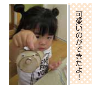
可愛いのができたよ！