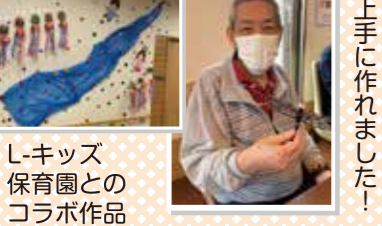
し-キッズ 保育園とのコラボ作品です