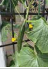
キュウリ になりました！