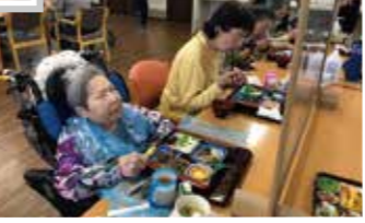
うなぎは、脂が乗ってる。