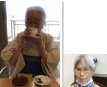
深みのあるお味です♪