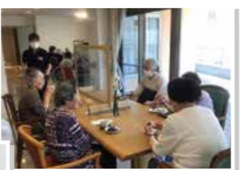
皆さんで頂くお茶はまた格別です！

6月9日、ライフステージ八山田では毎年恒例の新茶まつりを開催しました。 例年ですと、お茶屋さん主催で行っていましたが、新型コロナウイルス感染症対策により、今年は規模を縮小し、スタッフ主催で行いました。 お茶屋さんには上手に淹れられませんが、「香りが爽やかでおいしい〜！」と入居者様の声。来年は感染症もおさまり、また賑わう中での新茶まつりが開催できるといいですね。