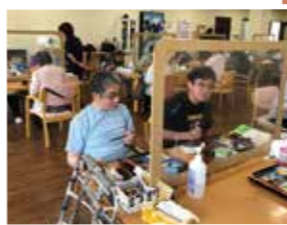
早めの企画をお願いします。