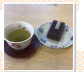
きれいな色ですね