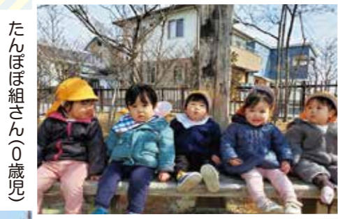
たんぽぽ組さん(0歳児)