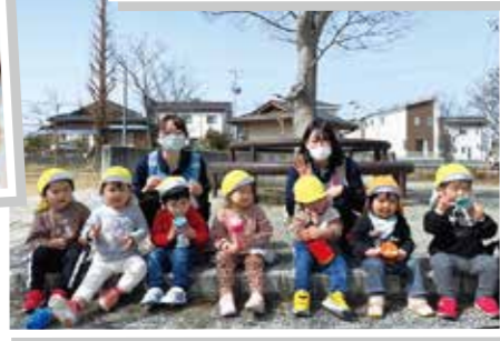
ちゅうりゅう組さん(1歳児)