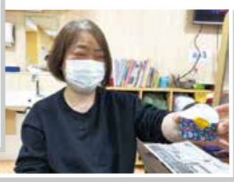
うまくできましたっ