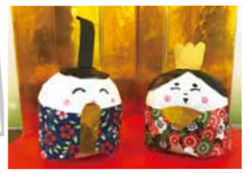
屏風の前に飾りました！