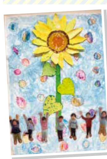
ひまわり組さん(2歳児)