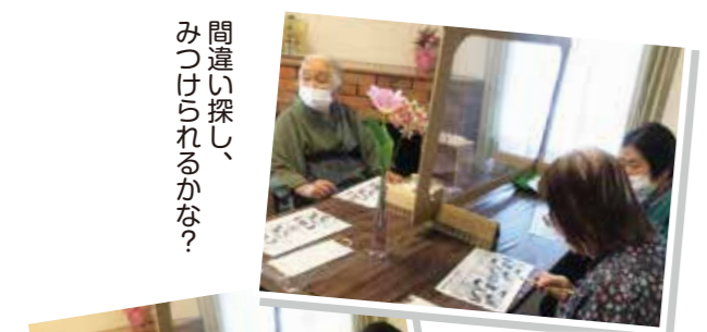
間違い探し、みつげられるかな？