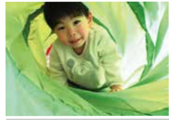
トンネル遊び大好き♡

みんな大きくなったね！ 令和3年度 修了しました！ 0歳児6名、1歳児6名、2歳児7名が3月31日に、無事、修了卒園を迎えました。