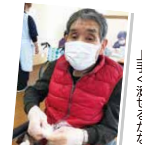
上手く潰せるかな？