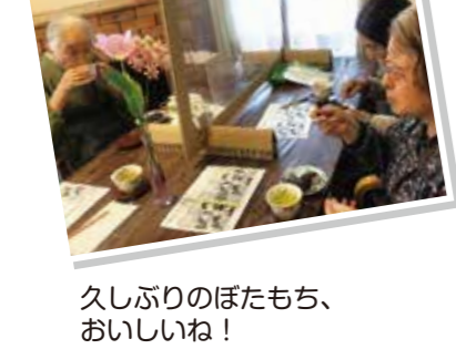
久しぶりのぼたもち、おいしいね！