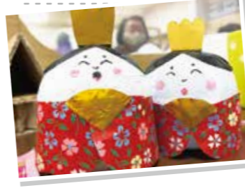
顔に個性が出ています♪

「コロナお雛様作成」 内容：3月3日は桃の節句「ひな祭り」でした。デイサービス三春では春の訪れを感じられるような行事という事で、ひな祭りクイズや歌、手作りのお雛様作りを行いました。クイズではひな祭りにまつわる問題に、皆さん昔を思い返しながら手を挙げ答えられています。お雛様づくりでは、トイパプセルに半紙を張り付け千代紙やパーツを貼り合わせながら作成し、仕上げに皆さんそれぞれに顔を描かれ、とても可愛らしい笑顔のお雛様と優しい眼差しのお内裏様が完成しました。