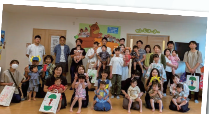
毎年テーマを決めて 夏祭り