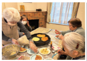
焼きたてホカホカ