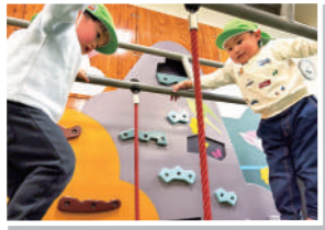
揺れる吊り橋にドキドキ