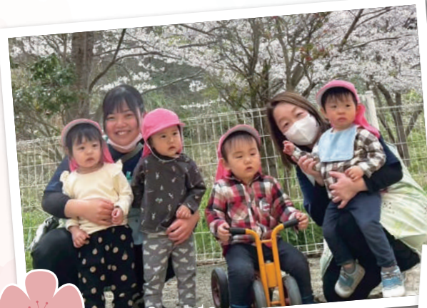
園庭の桜でお花見