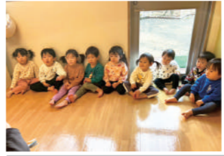
遊んでくれてありがとう