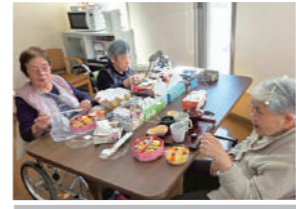
色とりどりのパンケーキ