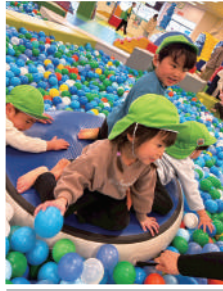
笑顔いっぱいボールプール