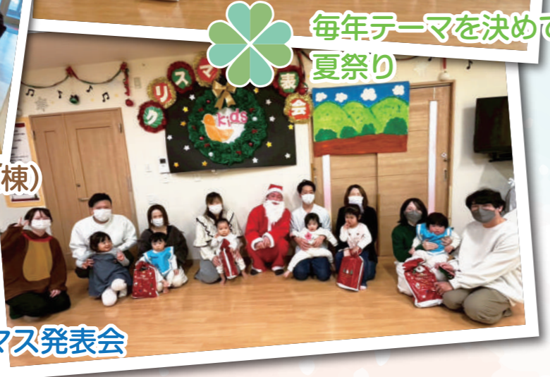
クリスマス発表会