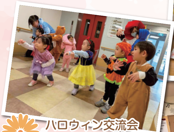
ハロウィン交流会 (デイサービス&居住棟)