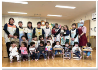
いつでも待ってるよ