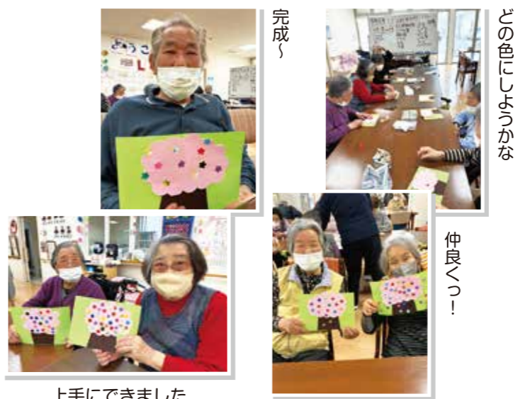
上手にできました

笑顔あふれる制作活動！ デイサービス三春では、春を感じられるポップアップカードを作成しました。利用者同士で「どの色にしようかな」と相談しながら、花の配置や飾り付けを楽しみながら進めました。完成した作品を手にすると、「上手にできたね」「家に飾りたい」と笑顔あふれ、和やかな時間となりました。季節を感じながら、集中して楽しく取り組むことができました。今後も季節の行事を楽しめるような企画を開催していきます。