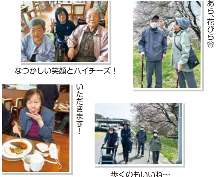
なつかしい笑顔とハイチーズ！

桜並木をお散歩！ ライフステージ三春では13日にお花見イベントを開催しました！三春駅裏に車を停め、桜並木をお散歩：少し散り始めでしたがそれがまた穏やかな風に舞ってひらひらと。地面にもうつすら花びらのじゅうたんのよう♡タンポポも咲いていて桜の淡いピンクと色鮮やかな黄色がとても綺麗でした。来年もここに来たいね！キレイだね！と皆様とても喜ばれていました。お花見のあとは八山田のエルマールにておいしいお食事を堪能されました！