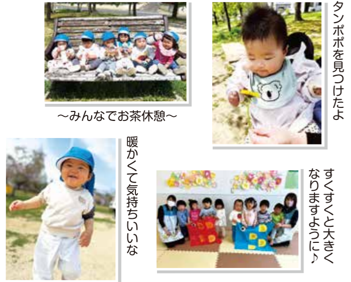
すくすくと大きくなりますように！

暖かくて気持ちの良い日！ エルキッズ保育園八山田の周りには様々な公園があり、天気の良い日には公園に出かけて伸び伸びと戸外活動を楽しんでいます。草花や虫を観察したり、遊具で遊んだり、広場で駆け回って体を動かしたりと、子どもたちの笑顔が溢れています。 2歳児クラスでは、5月の節句に大きなこいのぼりに挑戦しました。お絵描きをしたところを貼っていく、素敵なおいのぼりが完成しました。これからもエルキッズの子ども達がすくすくと育ちますように！