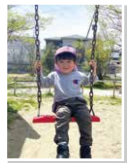
ポカポカ気持ちいい